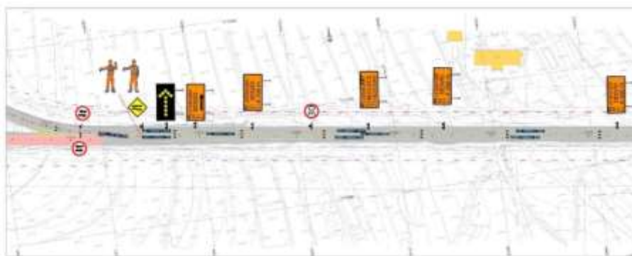
Esquema de señalización en zona de obras

Esquema de señalización: desvío en doble sentido de circulación (binario norte)